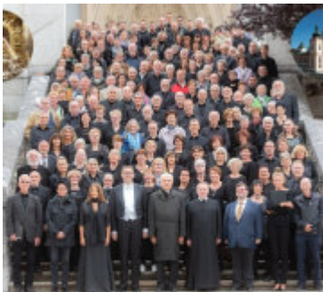
Chor- und Orgelwallfahrt der Erzdiözese Freiburg Mariazell im September 2019