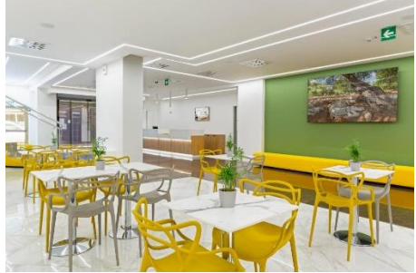
Victor Hotel ****