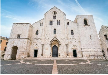
Bari, San Nikola