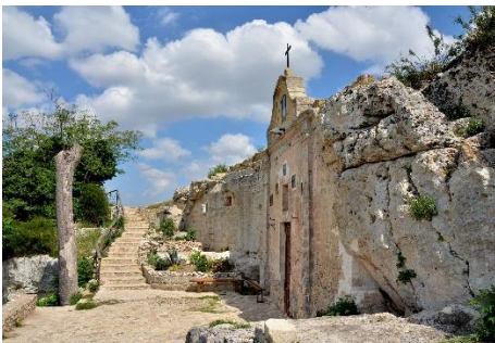
Matera, Belvedere di Murgia Timone